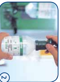
Oogschaal in pijlrichting draaien tot verzegeling verbroken is