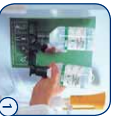
Flacon uit de houder nemen