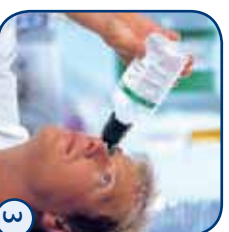
Hoofd achterover en spoelen